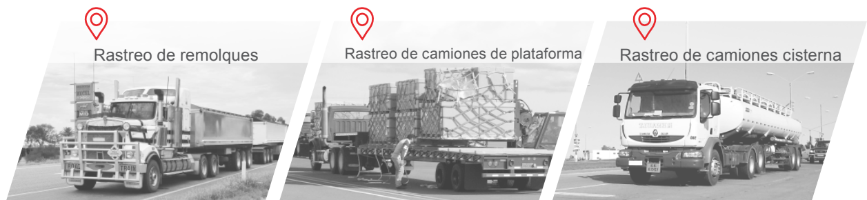
Rastreo de remolques

El GV648W es un WCDMA/3G producto diseñado específicamente para vehículos de uso pesado, incluyendo remolques, camiones cisterna, camiones refrigerados y camiones de plataforma. Su diseño altamente resistente e impermeable asegura que el producto siga siendo fiable cuando se instala en los entornos difíciles encontrados comúnmente en el transporte pesado, como lo es el transporte de combustible y de productos químicos. El GV 648W puede funcionar hasta tres meses sin energía externa, lo que lo hace ideal para el seguimiento de remolques incluso cuando está desconectado. La amplia gama de accesorios alámbricos preintegrados proporcionados por Queclink, o por nuestros socios cuidadosamente seleccionados, permite a los usuarios aplicarlo en diversas industrias de flotas.