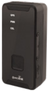
Serie Queclink GL300